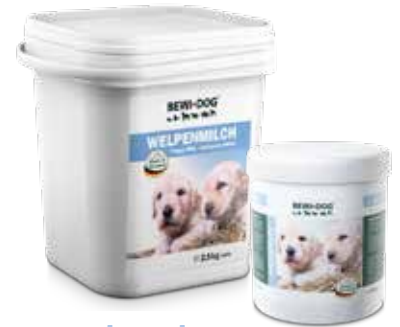
welpenmilch 0,5kg, 2,5kg